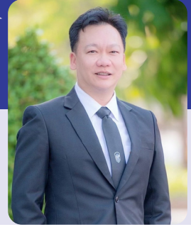
พระพิตน์ อิงพงษ์พิรินทร์ (๑)